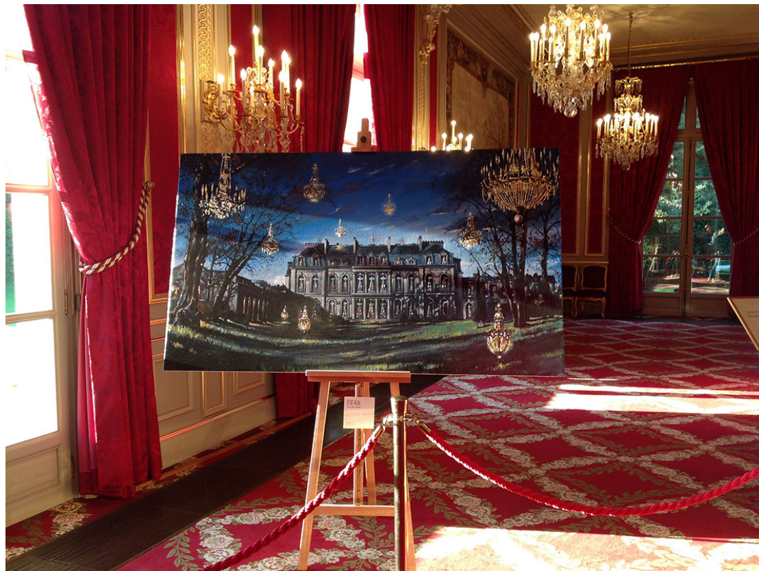
Palais de l'Élysée