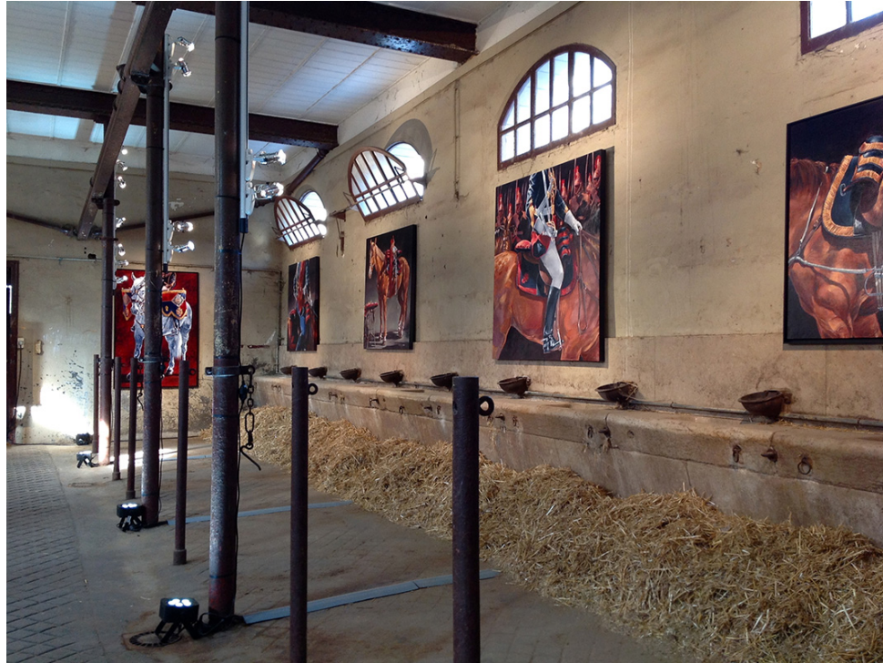
Exposition « A moi la garde ! » Ecuries « Le Fourgonnier » - 2014