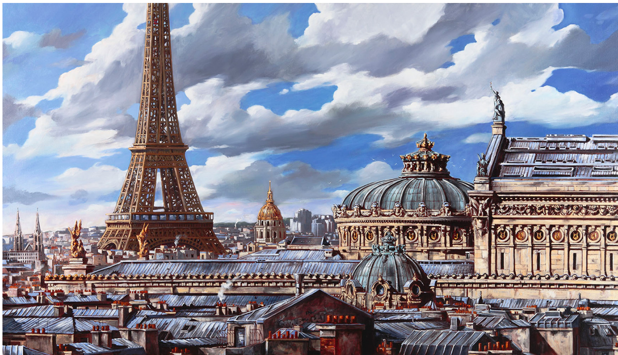
Mon Paris à moi 200 cm x 100 cm - Technique mixte sur toile